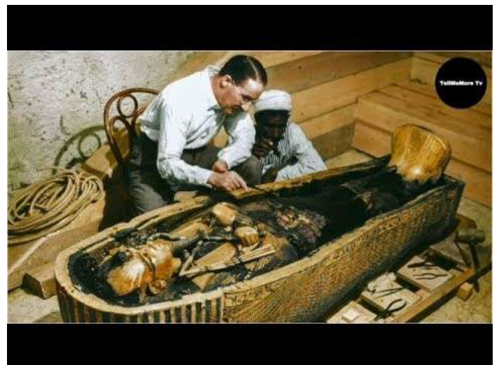
L'archéologue Howard CARTER et le sarcophage de Toutankhamon"

Au sein du Nouvel Empire, la XVIII e dynastie représente une période particulièrement riche. Les règnes d'Hatchepsout et de Thoutmosis III inaugurent l'ère des grandes constructions qui font de la région thébaine un des hauts lieux de l'architecture égyptienne : on pense aux temples de Deir-el-Bahari, de Karnak et de Louqsor.